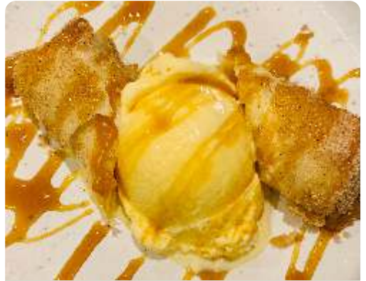
155. Harumaki de doce de leite servido com sorvete de creme. R$ 32

154. Tempurá de sorvete com calda de framboesa e laranja R$ 32