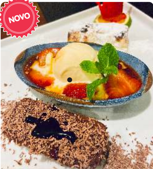
150. MENU DEGUSTAÇÃO 03 Mini Delícias do Chef R$ 44

151. Banana Crispy com sorvete de creme e calda de frutas vermelhas .....R$ 32