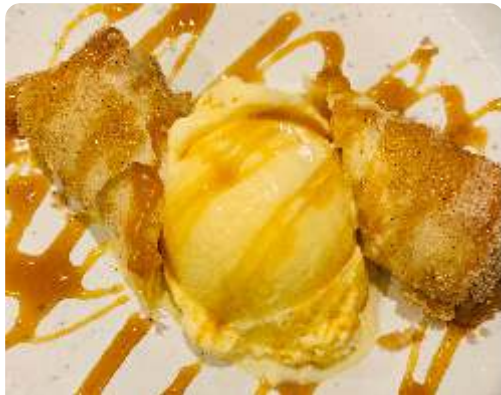
155. Harumaki de doce de leite servido com sorvete de creme. R$ 32

154. Tempurá de sorvete com calda de framboesa e laranja R$ 32