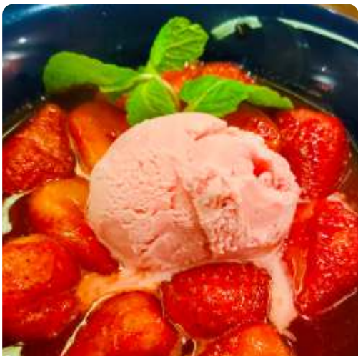
149. Fruta Flambada (Banana, Lichia, Morango OU Manga) com sorvete de creme R$ 32