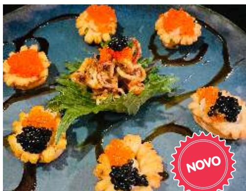
Gunkan de Lula com Ovas Mistas (06 unidades) R$ 84