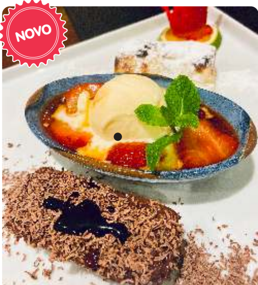
150. MENU DEGUSTAÇÃO 03 Mini Delícias do Chef R$ 42

151. Banana Crispy com sorvete de creme e calda de frutas vermelhas .....R$ 30