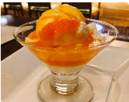
157. Sorvete com cobertura consultar sabores e caldas disponíveis. R$ 20

156. Harumaki de banana e chocolate servidos com sorvete .....R$ 30