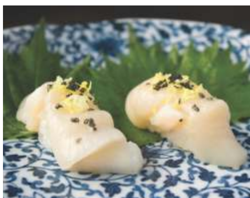
69. Vieira* , raspas de limão siciliano e sal negro R$ 35